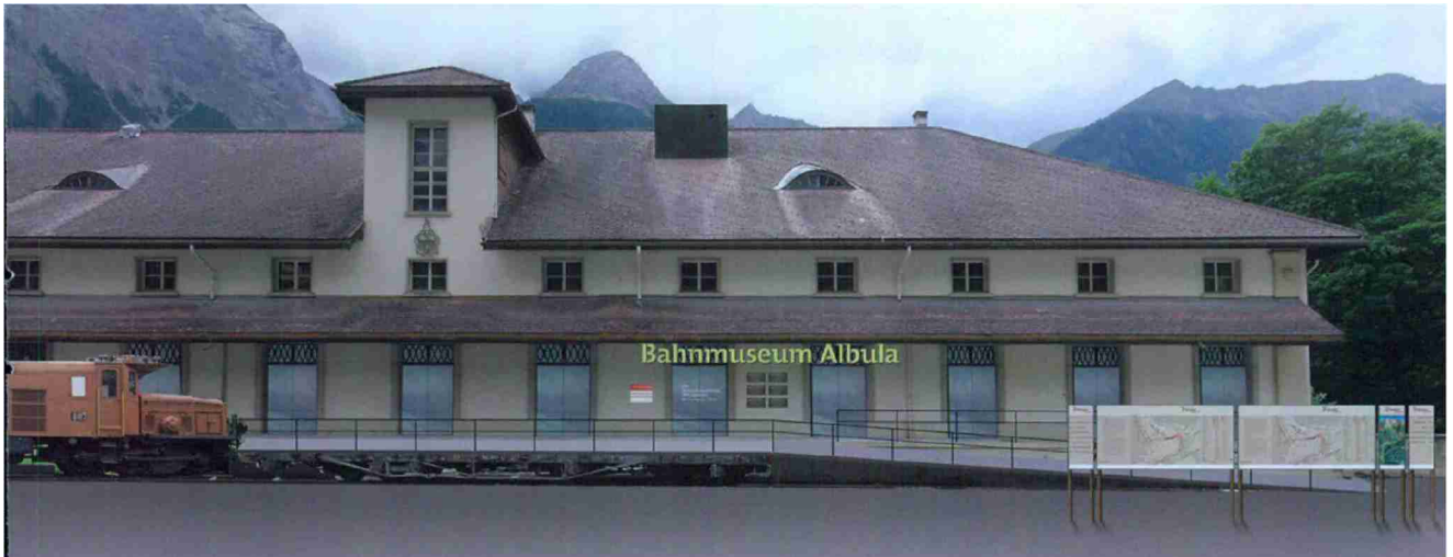
Eine einmalige Bahnreise beginnt bald: Mit dem Bahnmuseum Albula in Bergün wird die Bahngeschichte lebendig. Skizze: zVg

Themen-Nr.: 38.63 Abo-Nr.: 1088846 Seite: 29 Fläche: 37'150 mm 2