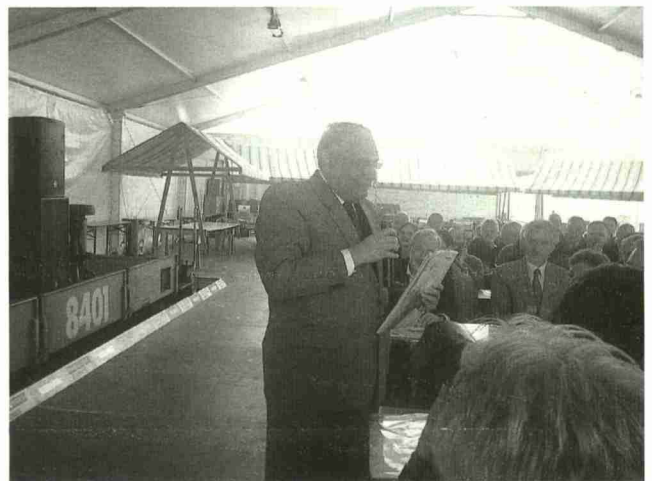
Il Chairman indiano presenta il suo campo d'azione in India ai con- venuti