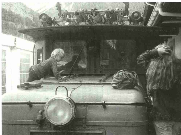
Una locomotiva coccodrillo del 1926 alla portata di mano dei bambini