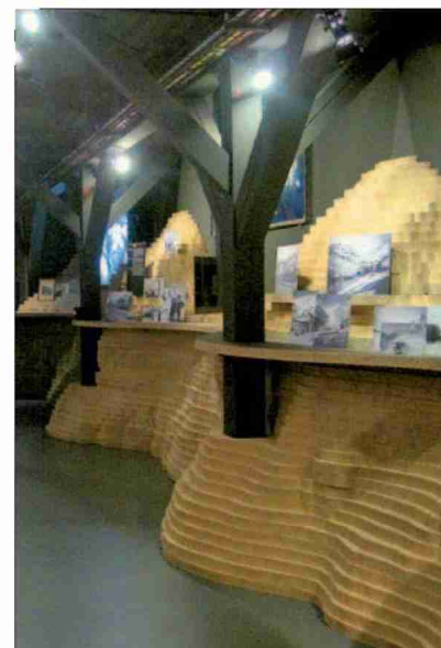
Le sale espositive sono concepite con la stessa topografia della montagna.