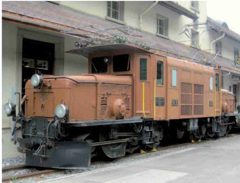
La leggendaria locomotiva Cocodrillo, direttamente davanti al museo.

Themen-Nr.: 38.63 Abo-Nr.: 1088846 Seite: 5 Fläche: 36'926 mm 2