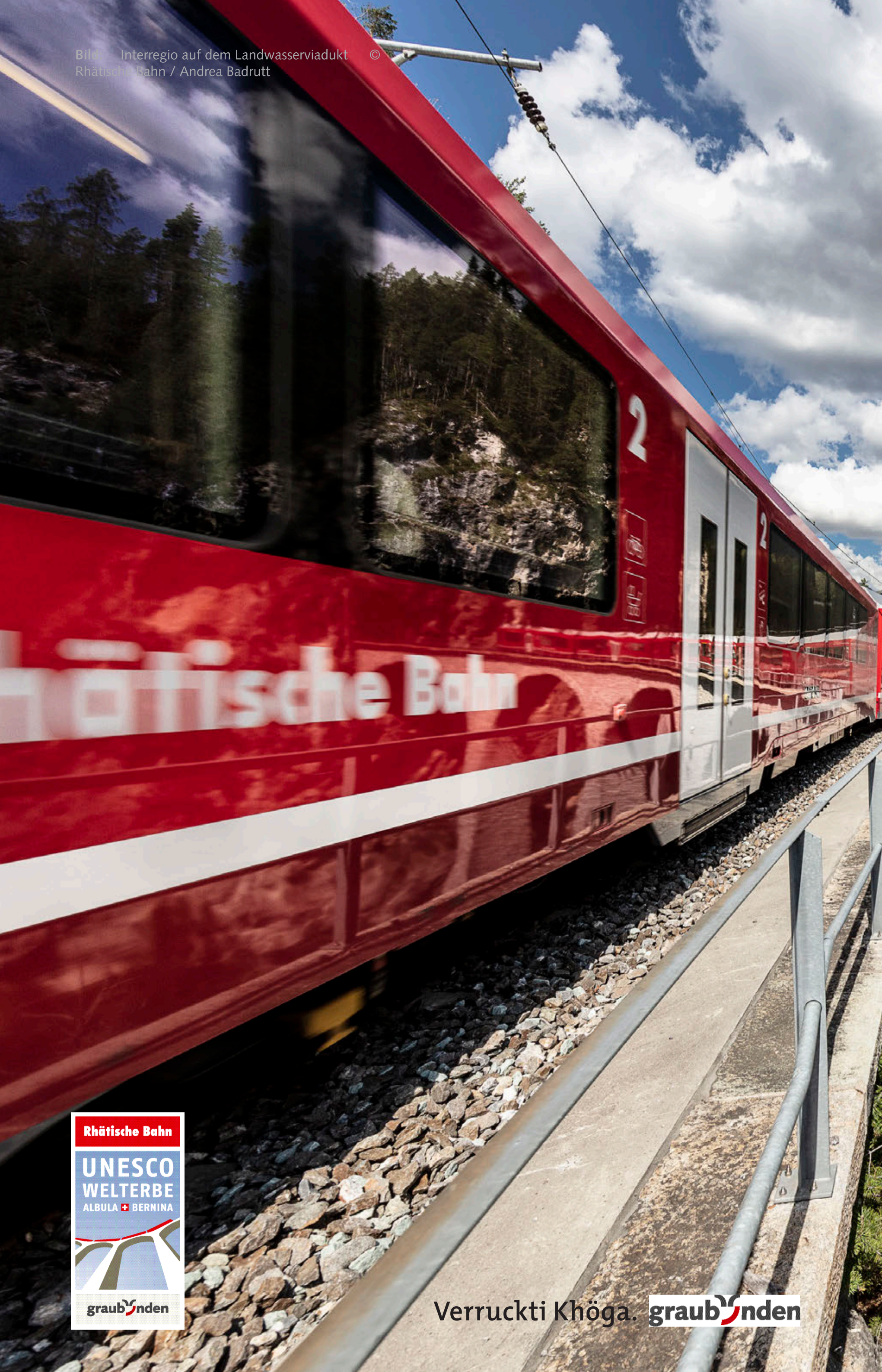
Bild: Interregio auf dem Landwasserviadukt