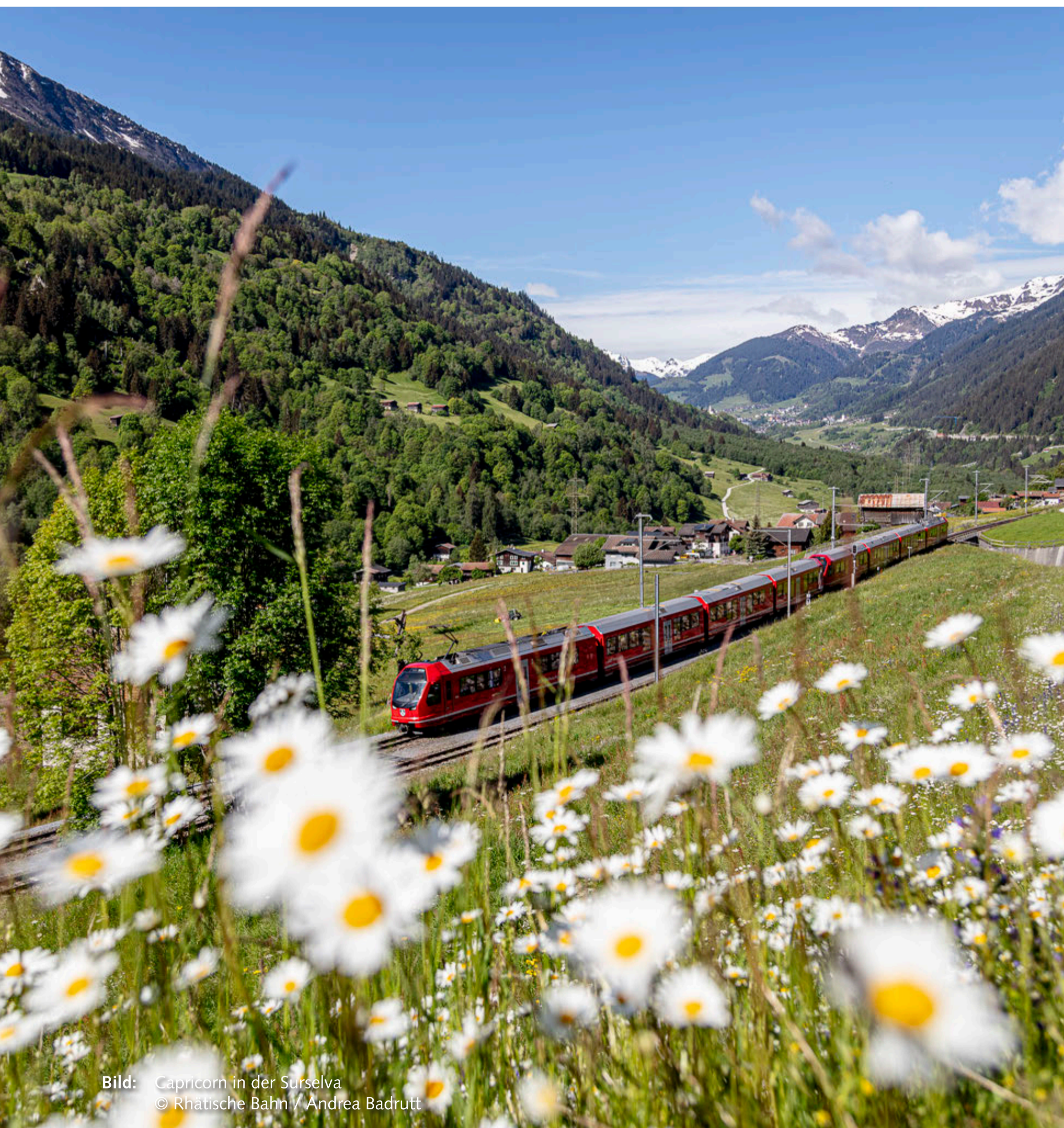
Bild: Capricorn in der Surselva