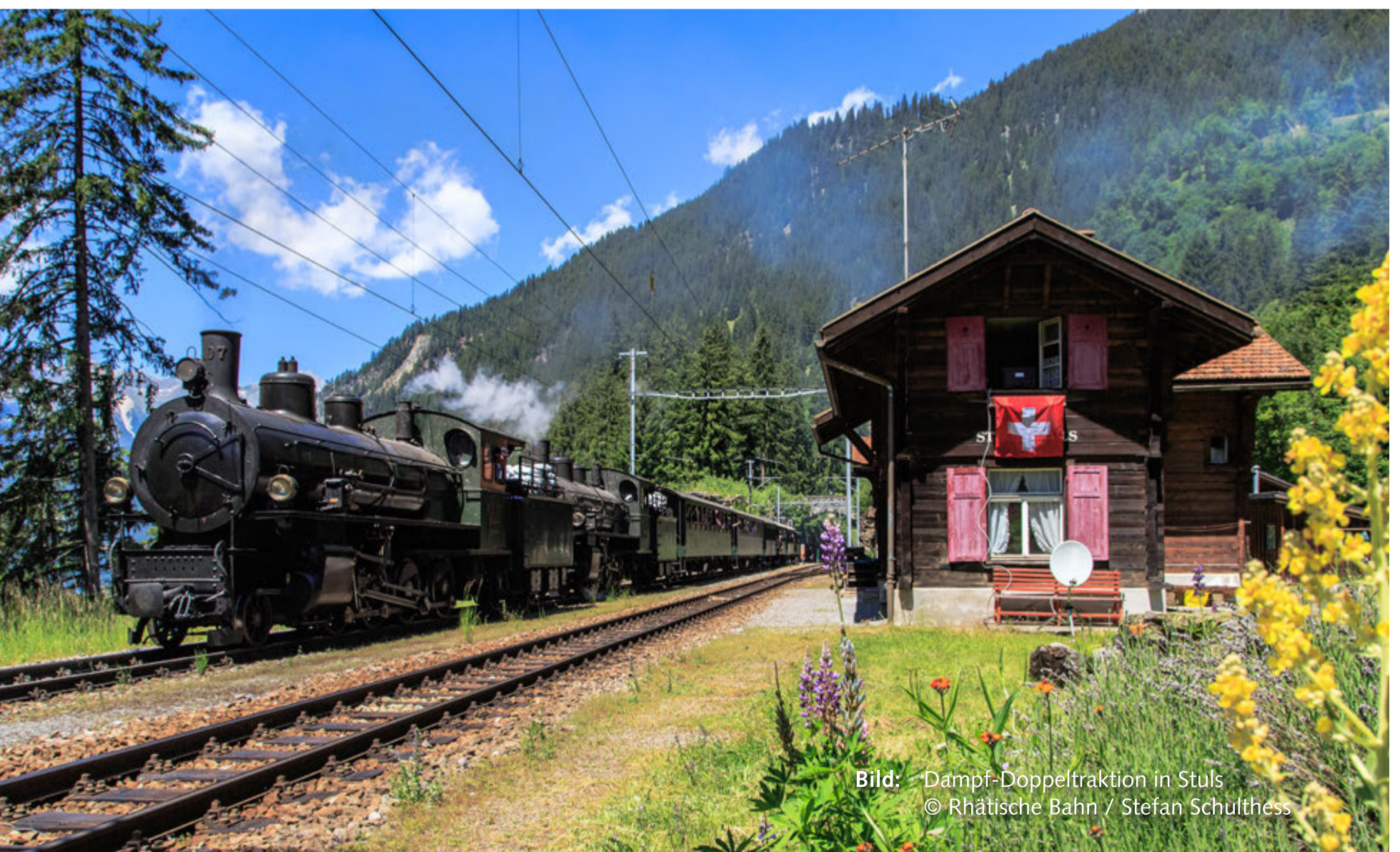
Bild: Dampf-Doppeltraktion in Stuls

Unsere Bahnhofsuhr wurde im Sommer 2013 im Bahnhof Davos-Platz abgebaut und dem Bahnmuseum Albula in Bergün übergeben. Sie wurde wahrscheinlich anlässlich des Umbaus des Stationsgebäudes Davos-Platz 1949 durch Rudolf Gaberel errichtet. Wie Hilfiker steht auch Gaberel im Rahmen der internationalen Moderne der Jahre nach 1930 und prägte das Bild von Davos in den folgenden Jahrzehnten.