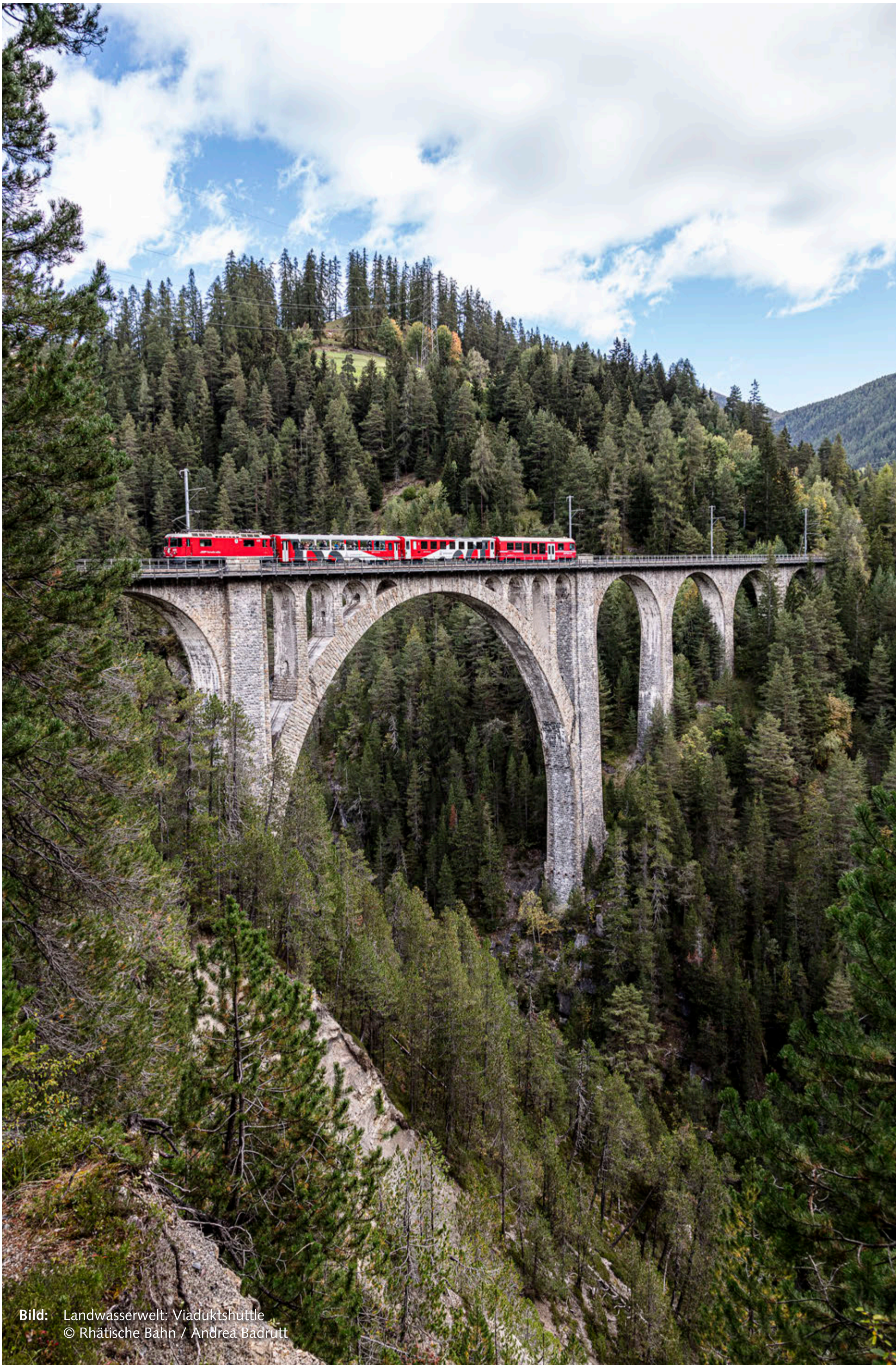
Bild: Landwasserwelt: Viaduktshuttle